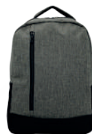
JASPE CLARO /127