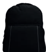
NEGRO JASPE /119